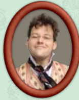
Theodore „Laurie“ Laurence Der elternlose Enkel von Mr. Laurence wird von Jo March „Teddy“ genannt.