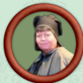
Hannah Die Haushälterin ist der gute Geist im Hause March.