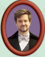
Prof. Friedrich Bhaer Der deutsche Professor übersetzt Goethe und Schiller ins Englische.