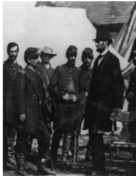
Abraham Lincoln bei einem Truppenbesuch im Gespräch mit Soldaten der Nordstaaten