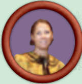
Mrs. Norton Die kultivierte und kokette Witwe ist ziemlich neugierig.