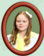
Amy March Die jüngste der Schwestern ist quirlig und aufbrausend, aber eine Künstlerin. Das Malen ist ihre Passion.