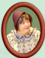
Margaret „Marmee“ March Sie ist die verständnisvolle Mutter der vier Schwestern.