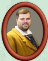
John Brooke Der Hauslehrer von Laurie ist gebildet und hilfsbereit.