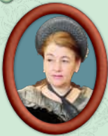
Louisa May Alcott Die Schriftstellerin möchte bei den Roberts Brothers ihren autobiographischen Roman verlegen lassen.