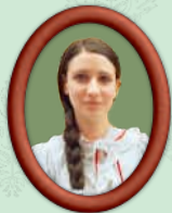
Margaret „Meg“ March Die älteste der Töchter ist schön, damenhaft und vernünftig.