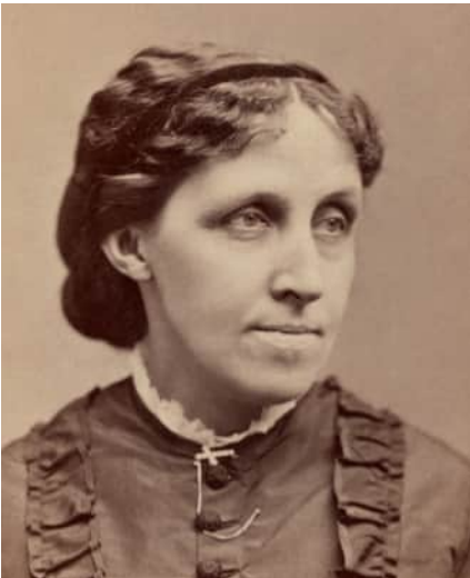
Louisa May Alcott. Fotografie von 1870

Wir erleben, wie sie von kleinen Mädchen zu jungen Frauen heranwachsen und zahlreichen Hindernissen die Stirn bieten. Jede von ihnen geht ihren eigenen Weg und vergisst dennoch nicht, dass Liebe und Familie über allem stehen.